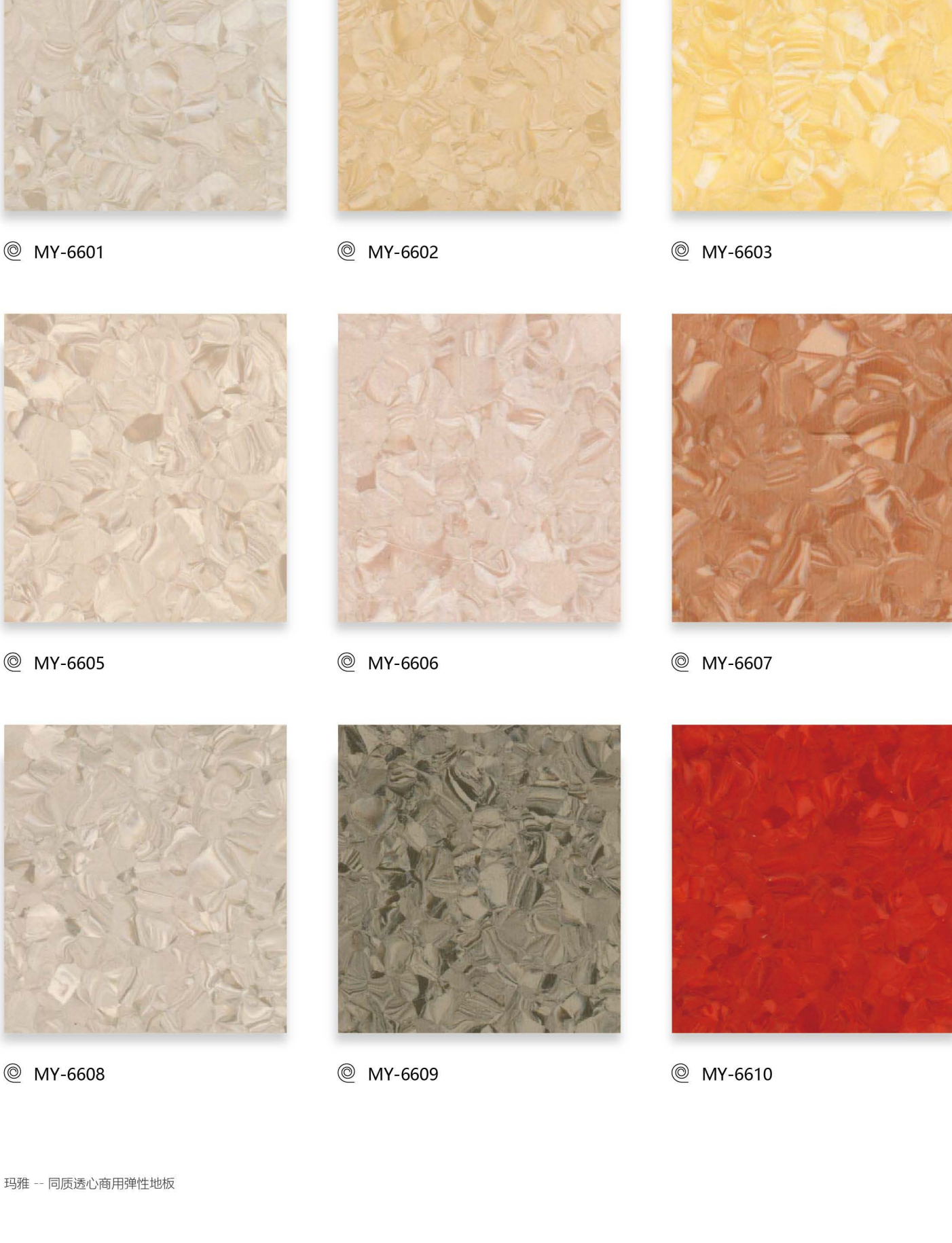
玛雅 -- 同质透心商用弹性地板