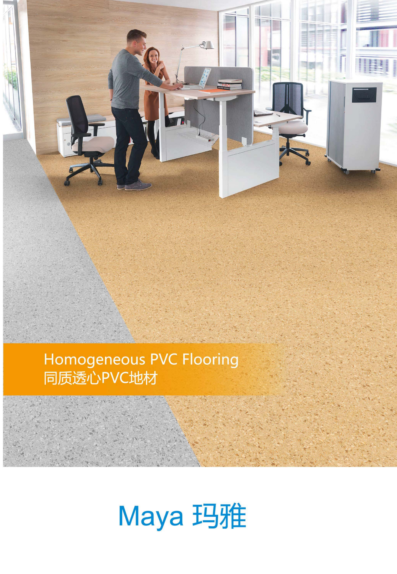
Homogeneous PVC Flooring 同质透心PVC地材